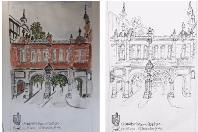
Utrecht – Moreelsepark

Tussen alle drukte van werk, gezin en studies door, deed ik daar nog wel iets hiermee. Zo ontwierp ik onze huwelijkskaart, maakte ik met de hand het geboortekaartje van onze dochter. Kalligrafeerde ik met een vriendin de tekst.